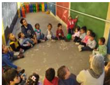
Bate- papo Tema: Bons modos para uma boa convivência em grupo.