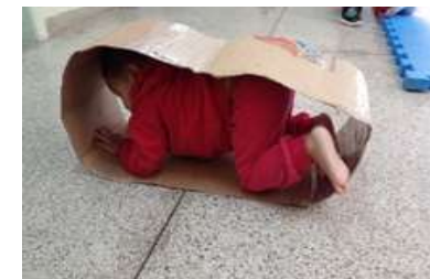
Brincadeira – Rastejando no papelão

Sede: – ALAMEDA DA CRINÇA, 105 – VILA VITÓRIA (19) 3875-4598