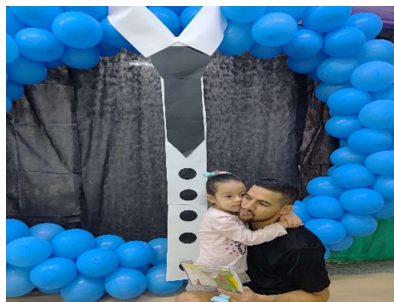
Dia dos Pais – Expressando carinho para o Papai