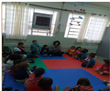
Roda de Conversar – Apresentando o nome do papai