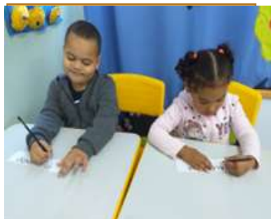
Escrita espontânea do nome