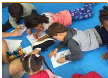
Participando da confecção do livro folclórico “Saci Pererê”