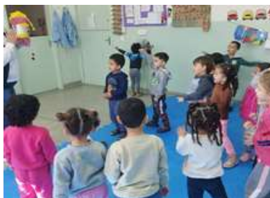
Brincadeira com a Boneca de lata (Musicalização)