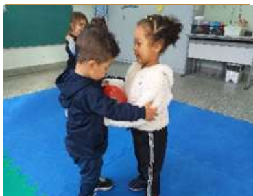
Jogos cooperativos – Carregar a bexiga com a barriga