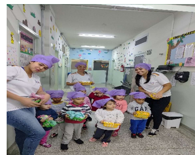
Participando da apresentação do Teatro “Lavadeira”