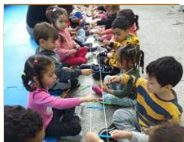
Equilibrando palitos (Explorando novas superfícies)