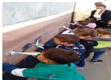
Pintura com Nariz – Expressando através do desenho