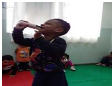
Sarau – Apresentando musicas escolhidas pelas crianças.