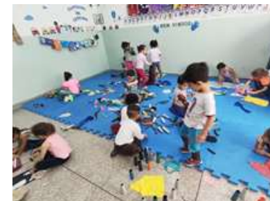
Brincadeira com tecidos e cones, se expressão livremente.