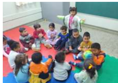
Brincadeira – “ Bola musical” Quando a bola parar a criança precisa cantar uma musica de sua escolha