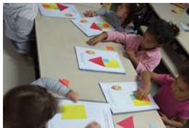
Criando formas Geométricas, utilizando massinha