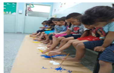
Explorando diferentes suporte de pintura (Pintura com os pés).