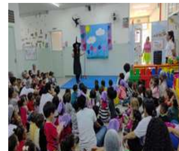
Assistindo teatro com outras turmas – convivendo com outras turmas

Sede: ALAMEDA DA CRIANÇA, 105 VILA VITÓRIA – (19) 3875-4598