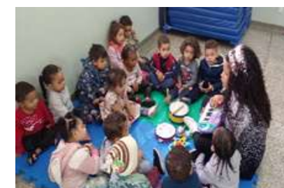
Explorando diversos som e ritmos Musicais (Bandinha).

Sede: ALAMEDA DA CRIANÇA, 105 VILA VITÓRIA – (19) 3875-4598