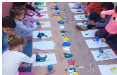
Explorando técnicas de pintura (Pintura com bexigas).