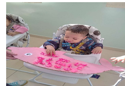
Participando da confecção do “Boto cor de Rosa”