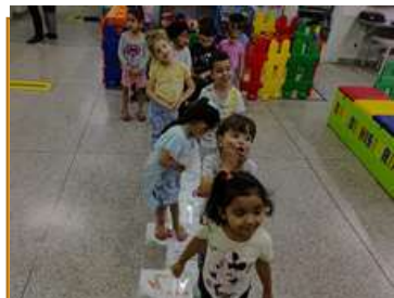
Amarelinha Folclórica Para pular precisa responder as perguntas.