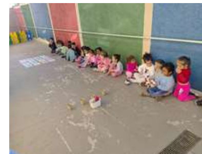
Circuito dos números – Contagem da turma