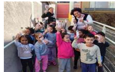
Brincadeira – Capturando o Saci para colocar na garrafa.