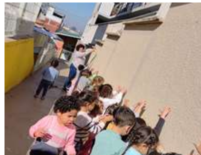
Brincando com a sombra – Conhecendo o seu próprio corpo